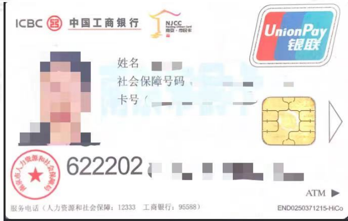
南京市民卡（一代卡）

622202卡bin开头，卡面有“南京市民卡”字样。该卡为2021年之前南京地区社保医保的主要介质，该卡不支持异地就医功能。